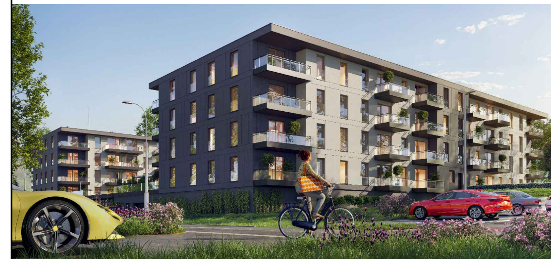
BUDYNEK NR 1 POŁOŻENIE MIESZKANIA W BUDYNKU