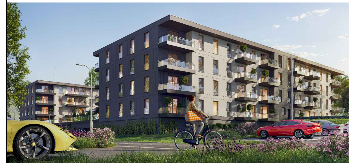
BUDYNEK NR 1 POŁOŻENIE MIESZKANIA W BUDYNKU