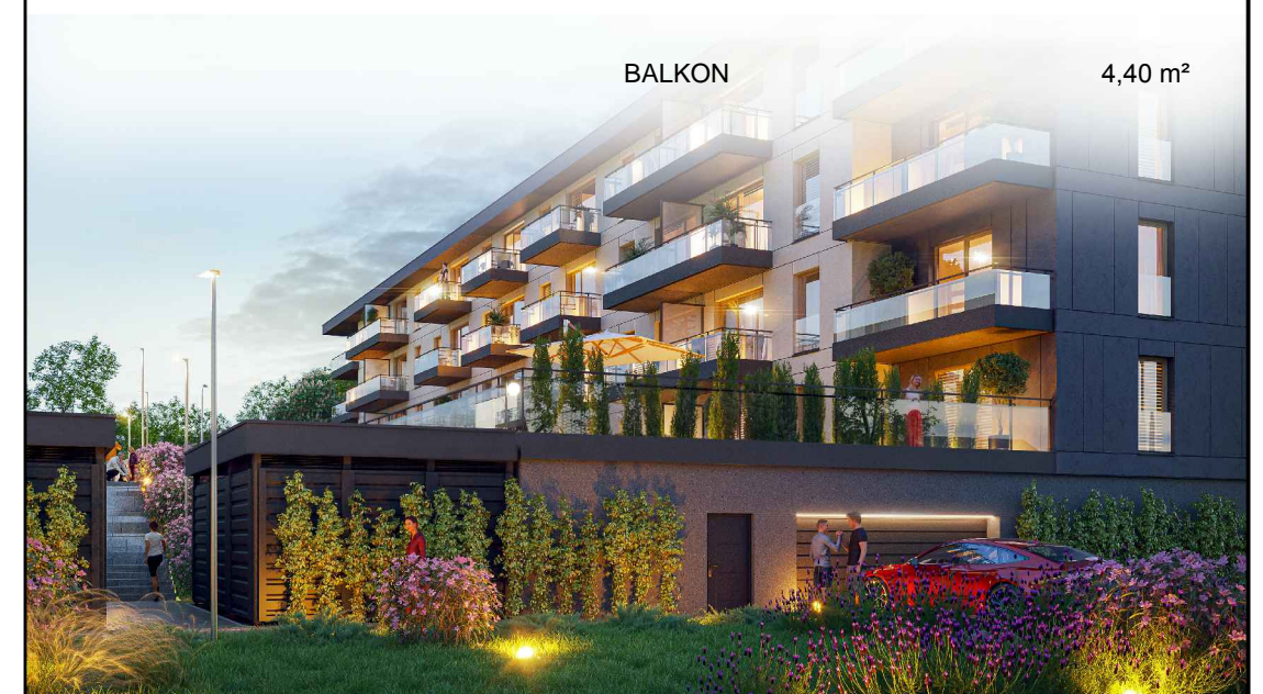
BALKON 4,40 m 2