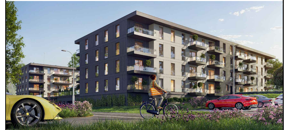
BUDYNEK NR 1 POŁOŻENIE MIESZKANIA W BUDYNKU

UWAGA: NINIEJSZA KARTA KATALOGOWA NIE STANOWI OFERTY W ROZUMIENIU KODEKSU CYWILNEGO. PLAN MIESZKANIA ORAZ POWIERZCHNIE MOGĄ ULEC ZMIANIE W TRAKCIE REALIZACJI BUDYNKU.